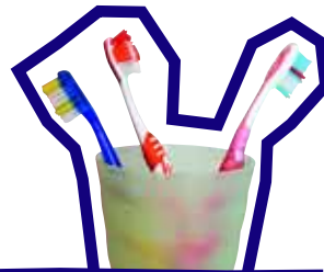
Zähneputzen: Céline gibt den Takt vor