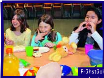
Frühstücken im Gemeindesaal schmeckt doppelt.